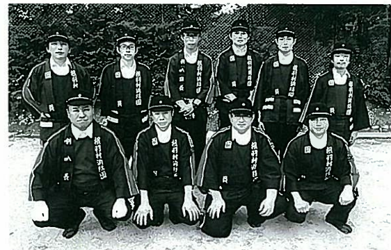
ラッパ班の皆さん

7月17日(日)売木村で飯伊消防技術大会が盛大に開催されました。当村からは第2分団(小型ポンプ操法の部)・ラッパ班が出場しました。大会に向け連日練習に励んできました。当日は猛暑の中でしたが、長期間にわたり練習してきた成果を十分に発揮できました。選手をはじめ関係者の皆さん大変お疲れさまでした。