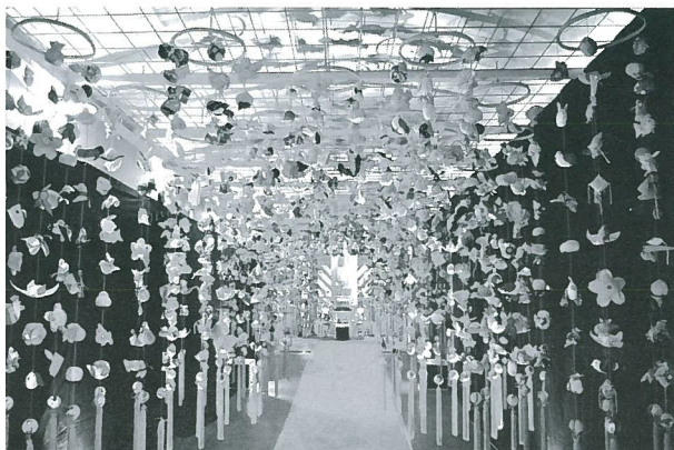
ねばーらんどの二千体吊るし雛くぐり

ねばーらんどの特設会場に吊るされた二千体飾りの下を、ねばーらんどを訪れてくださった皆様方にくぐっていただくことにより、くぐられた皆様の厄を払い多幸を願わせていただきます。その他にも、小さな小窓から中をのぞいて鑑賞する「のぞき雛」や、根羽村に古くから飾られてきた「土雛」が展示されるなど、様々な飾り方の雛祭りが展示されます。