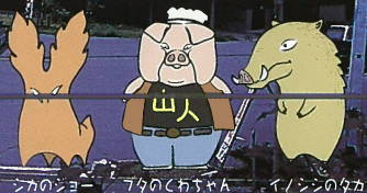
シカのジョー ブタのちやん イノシシのタカ