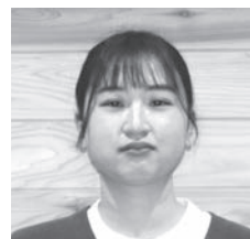
住民課配属 長野県南箕輪村出身