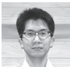
総務課配属 長野県長野市出身